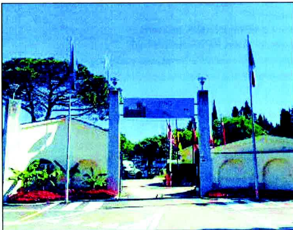
Ingresso Camping Lazise